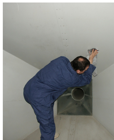
Fot. 7. Wcieranie środka konserwacyjnego w powierzchnię sufitu