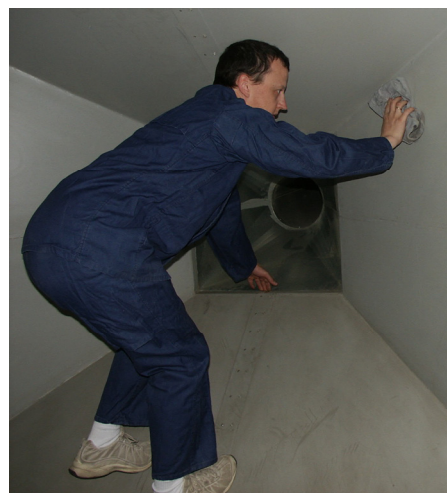
Fot. 6. Wcieranie środka konserwacyjnego w powierzchnię ściany – 2