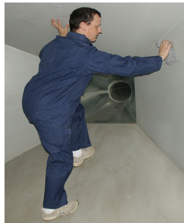
Fot. 5. Wcieranie środka konserwacyjnego w powierzchnię ściany – 1